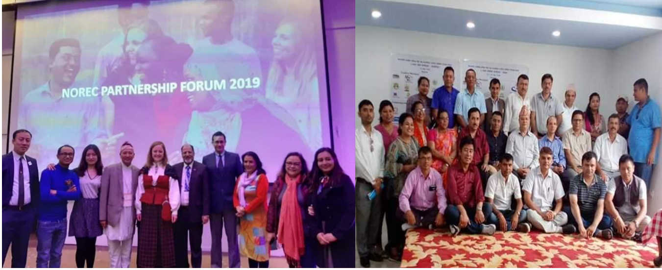
अन्तर्राष्ट्रिय साभेदारी बैठक (नर्वे) र राष्ट्रिय साभेदारी अभिवृद्धि कार्यशाला (विराटनगर) मा संस्थागत सहभागिता