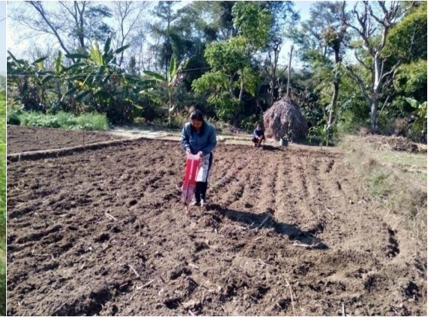
महिला समुहमा व्यावसायिक किसानहरुलाई फलफूलका विरुवा वितरण र तरकारी खेतीमा आधुनिक प्रविधि प्रयोग, दाङ