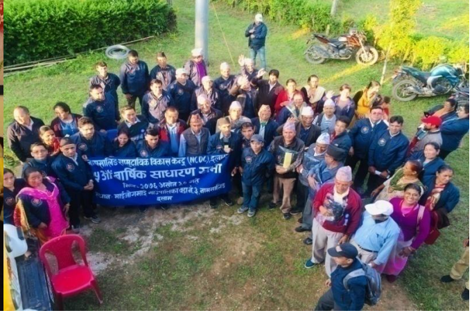
२५ औं नासाविके साधारण सभा उद्घाटन र सभा समापन पछिको सामुहिक तशिवर (२०७६ असोज ३० गते)