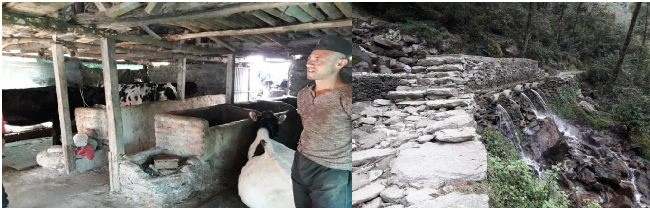
स्थानीय सरकारसगको लागत साभेदारीमा प्रबर्द्धित नमुना गोठसुधार र पूर्वाधार (कल्भर्ट) निर्माण, कालिञ्चाक दोलखा