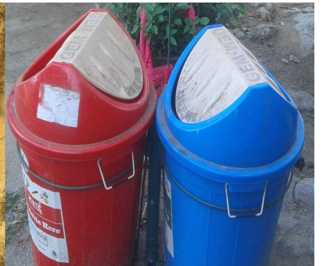
सामुदायिक सचेतना कार्यक्रम सहित प्रवर्द्धन गरिएको एकीकृत फोहरमैला व्यवस्थापन अभ्यास (राप्ती गा.पा., दाङ