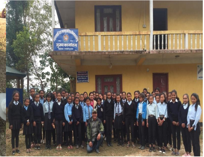
सामुदायिक स्वास्थ्य, सरसफाई र दिगो सामुदायिक विकास बारे स्वयम्सेवक र विद्यार्थीहरु बीच अन्तक्रिया, माईजोगमाई इलाम