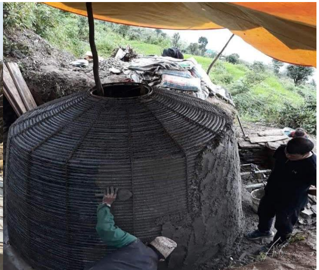
स्थानीय गाउँ पालिकाहरुसँगको स्रोत साभेदारीमा निर्माणाधिन खानेपानी टेंकी राप्ती, दाङ र कालिञ्चाक दोलखा