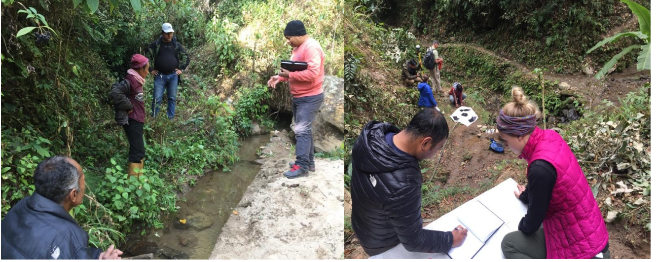
खानेपानी आयोजनाको प्राविधिक सम्भाव्यता अध्ययन तथा स्थलगत नक्सांकन: माईजोगमाई, इलाम

आ.व. २०७६/०७७ अवधिका संस्थाका स्थलगत विकास गतिविधिहरु सम्बन्धी केही प्रतिनिधिमूलक तशिवरहरु