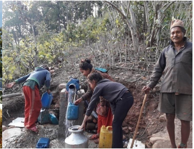
निर्माणाधिन अवस्थामा सौर्यऊर्जा प्रणालीमा आधारित सामुदायिक खानेपानी लिफ्टइ आयोजनास्थल, राप्ती गा.पा. दाङ