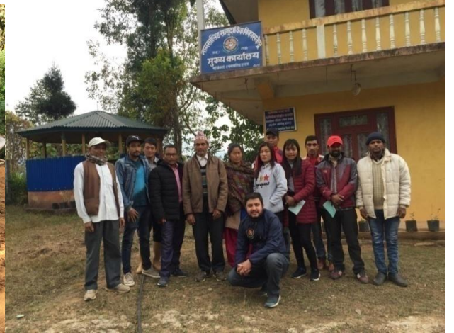
एक किसान एक नर्सरीका लागि संचालित अगुवा कृषक तालिम र नमूना नर्सरी निर्माण: माईजोगमाई, इलाम