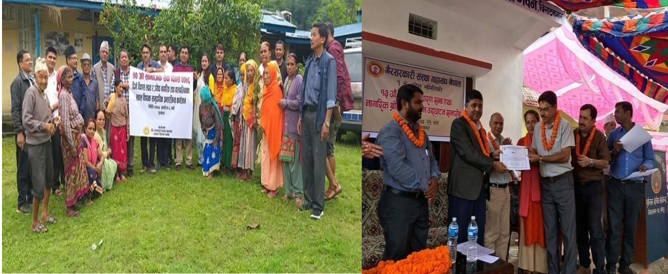
४०औं सामाजिक सेवा दिवस (इलाम) र गैसस महासंघ १ नं. प्रदेशको साधारण सभामा संस्थागत प्रशंसापत्र ग्रहण