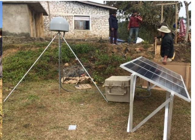
ड्रोन प्रविधिबाट खानेपानी आयोजनाको सर्भेक्षण र भौगर्भिक हलचल अनुगमन स्टेशन, माईजोगमाई, इलाम