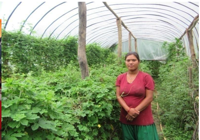
नागदेवाली मूल्य श्रृंखला अभिवृद्धिका लागि व्यावसायिक अचार तयारी तालिम र टनेल खेती, राप्ती गा.पा. दाङ्ग