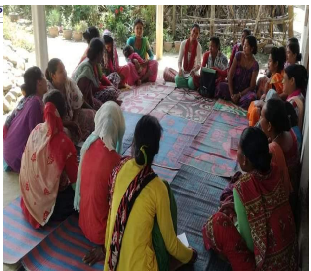
राष्ट्रिय छाप सञ्चारमा आएको समाचार (दोलखा) र स्थानीय विकास सवालमा महिला समुह बैठक, राप्ती गा.पा. दाङ